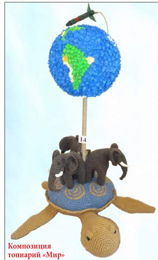
Композиция топиарий «Мир»