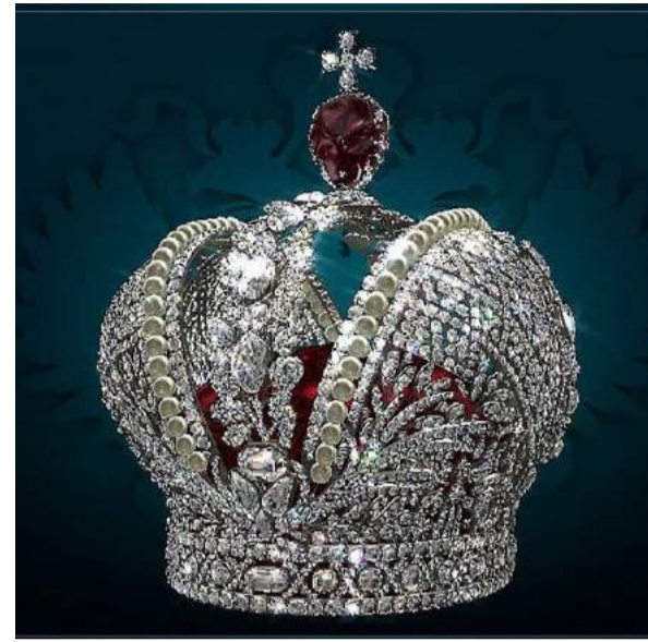
Мы испытываем чувство гордости за свою страну, что сумела сохранить такие сокровища и шедевры мирового искусства до наших дней.

Посетив музей «Алмазный фонд», мы получили огромное удовольствие и неизгладимые впечатления. Мы испыты-